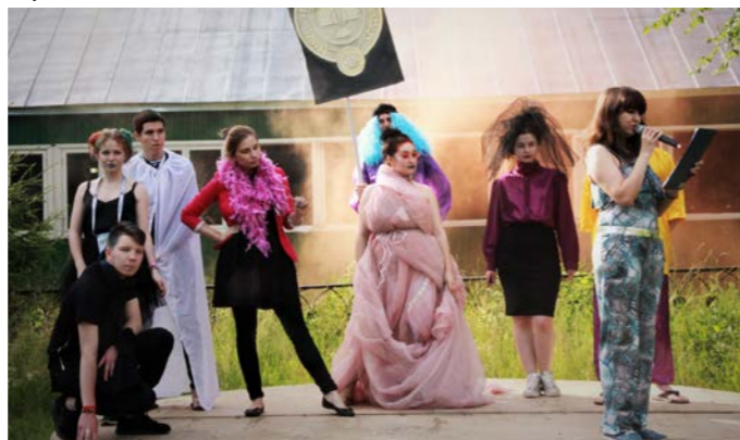
Нижнекамский химико-технологический институт