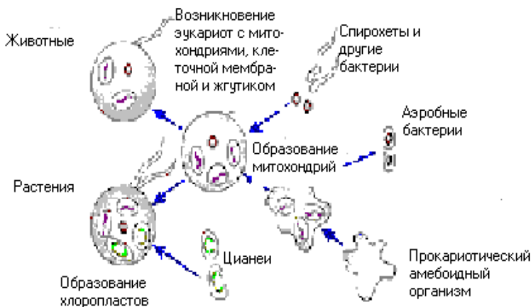
Схема иллюстрирует гипотезу происхождения эукариот – ... Предложите ответ:

251. Корпускулярные свойства света проявляются в том, что: